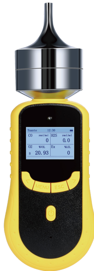
SKY2000-M便携式气体检测仪